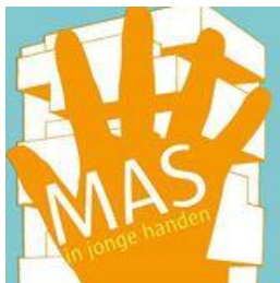
MAS in Jonge Handen