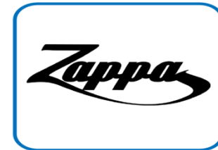
Permanentieverantwoordelijke JCC Zappa